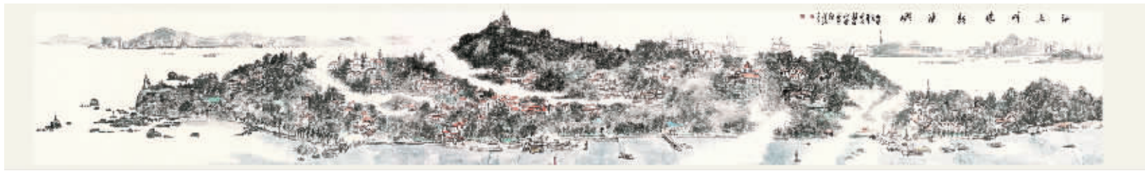
牛惠民作品《国之瑰宝鼓浪屿》