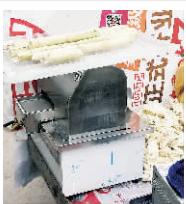
厦门一些商贩所使用的榨汁机，并未暗藏玄机。 P184020214

记者从思明城管了解到，其辖区内无证售卖现榨果汁的占道经营摊点，主要出现在中山路、厦门大学一带。截至目前，执法人员在执法过程中，尚未发现有摊贩使用“污水掺甘蔗汁”的制假、售假设备。不过，思明城管提醒