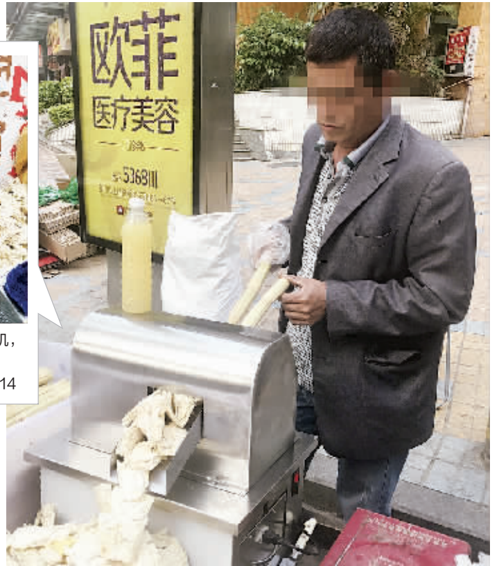
商贩正在操作榨汁机。 P184020211

市民朋友，无证的占道经营摊点，其商品来源无人监管，使用不合格商品的概率相对较大。因此，思明城管建议市民要到有资质的商家消费，建议市民不去吃路边摊，到正规门店才能更放心地消费。